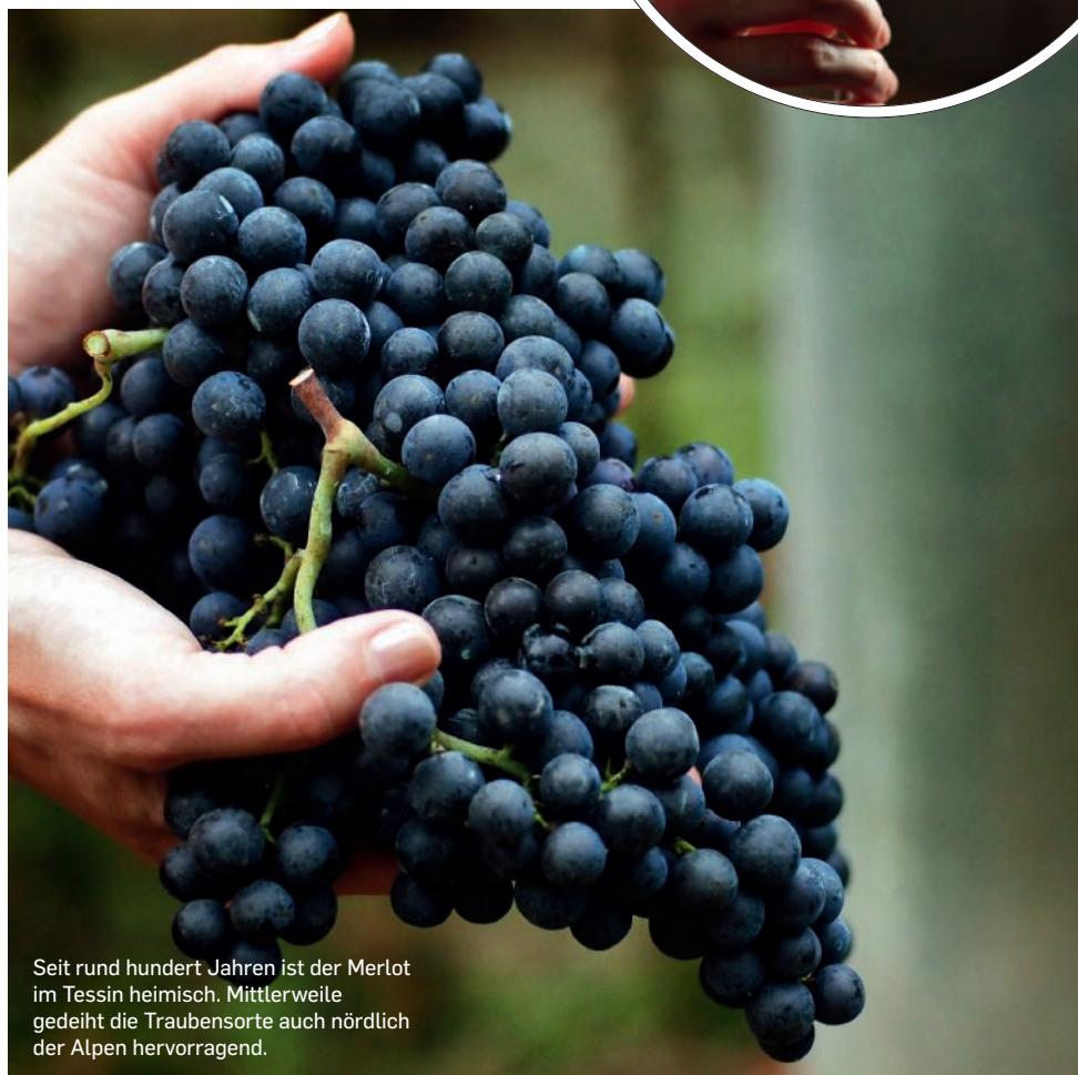
Seit rund hundert Jahren ist der Merlot im Tessin heimisch. Mittlerweile gedeiht die Traubensorte auch nördlich der Alpen hervorragend.

E s gibt wenige Sorten, die in der gesamten Schweiz qualitativ hochwertige Weine hervorbringen. Merlot ist aber definitiv eine davon. Natürlich: 87 von den 116 für diese Trophy verkosteten Schweizer Merlots stammen aus dem Tessin, womit die Kräfteverhältnisse schon mal geklärt wären, doch die Vielfalt ist grösser denn je. Die Spitze der Verkostung wird von einem Tessiner Wein angeführt – dem Castello di Cantone 2022 vom gleichnamigen Weingut im Norden Mendrisios. Ein faszinierender Wein mit dunkler, enorm vielschichtiger Frucht, Edelholznoten und Gewürznuancen. Ein Wein von grosser Harmonie, der sich mit internationalen Spitzenweinen nach Bordeaux-Vorbild mehr als messen kann. Und das auch in Verkostungen wiederholt bewiesen hat.