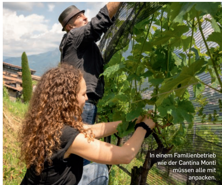
In einem Familienbetrieb wie der Cantina Monti müssen alle mit anpacken.